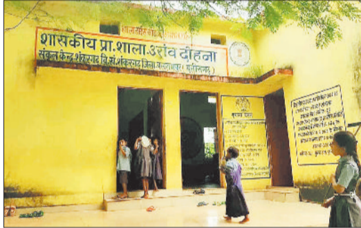
स्कूल में खेलते बच्चे।

शंकरगढ़। स्कूल में छुट्टी होने का इंतजार अक्सर बच्चे करते हैं लेकिन ग्राम पंचायत दोहना में ठीक इसके विपरीत है। यहां बच्चे नहीं बल्कि शिक्षक को छुट्टी होने का इंतजार रहता है। ऐसे में कुछ देरी हुई तो शिक्षक छुट्टी होने से पूर्व ही नदारद हो जाते हैं। आज पुनः शिक्षक विद्यालय की छुट्टी होने से पूर्व ही नदारद हो गए।